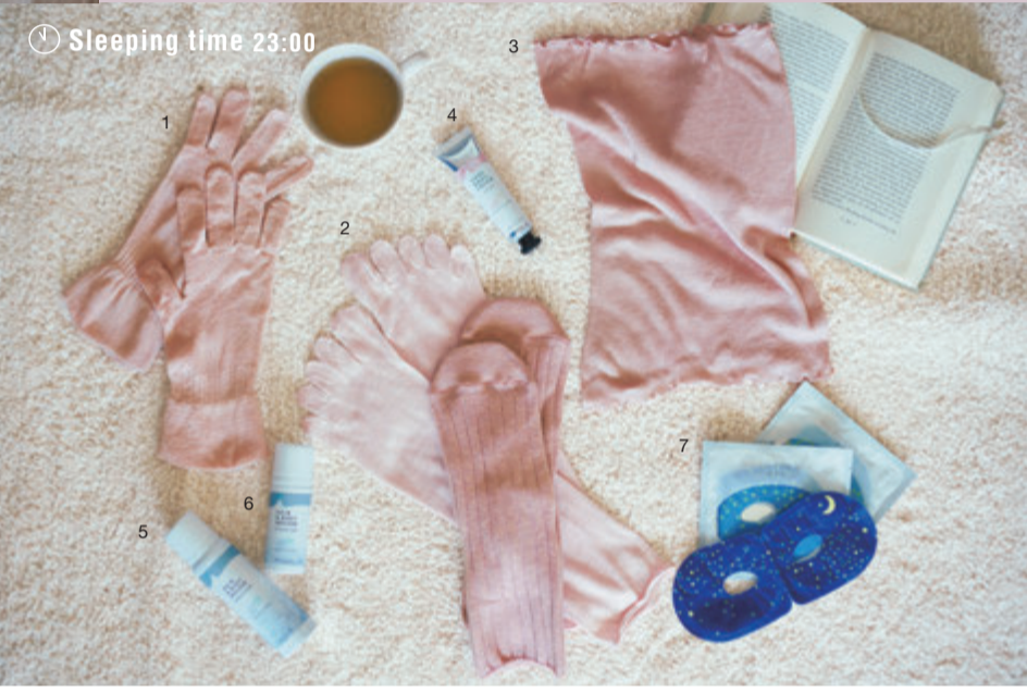
🕒 Sleeping time 23:00

温かな毎日に、シルクを。 滑らかな履き心地が特徴の5本指靴下や腹巻など、天然素材シルクを使ったアイテムで人気を誇る国内ブランド。日本製にこだわった高品質と高い技術力でも知られています。