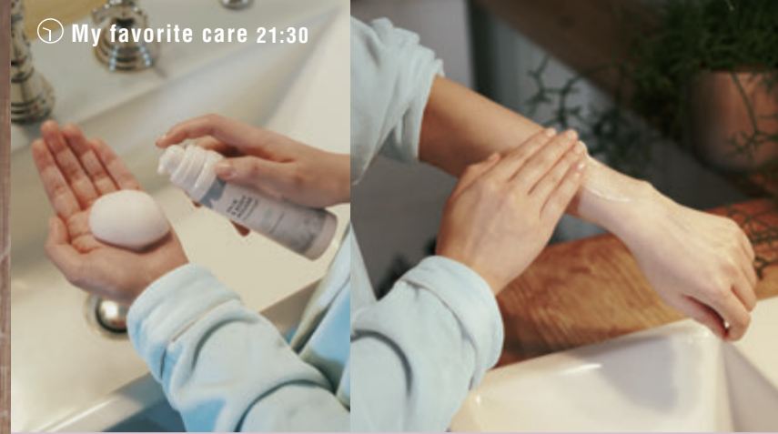
🕒 My favorite care 21:30