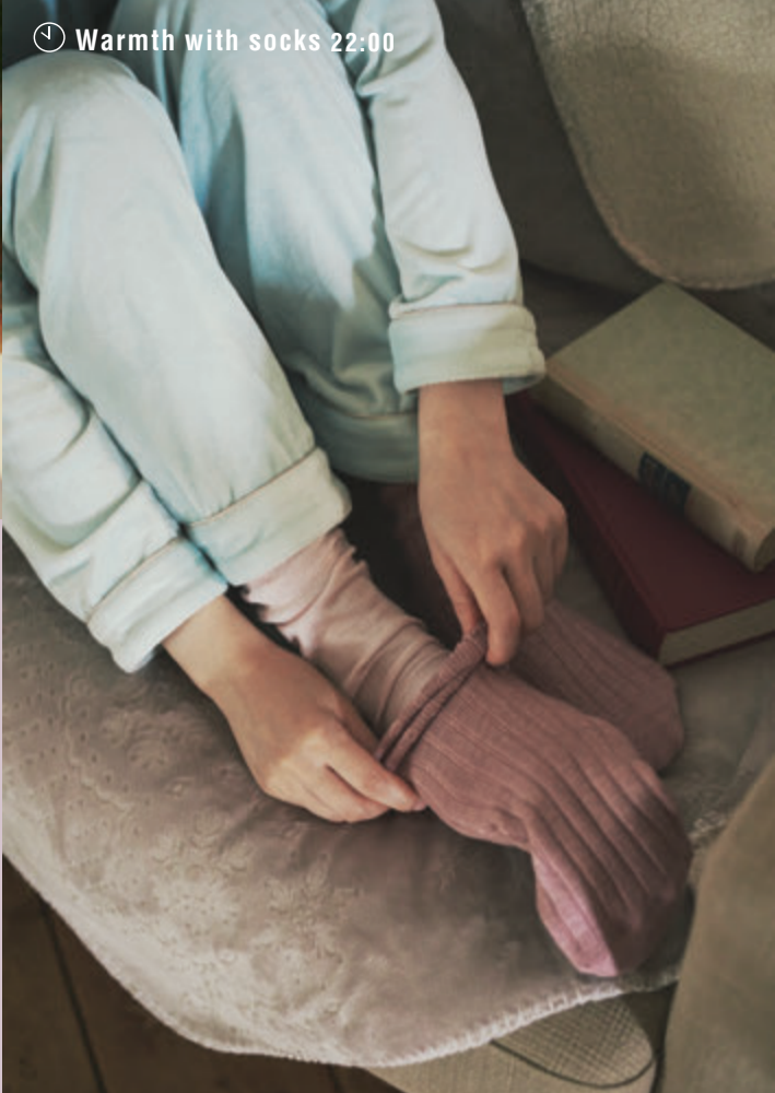
🕒 Warmth with socks 22:00