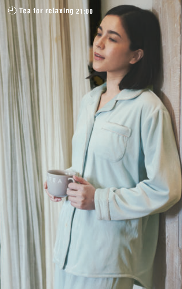
🕒 Tea for relaxing 21:00